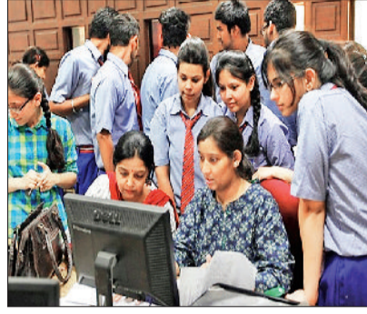
हरिभूमि न्यूज | रोहतक

उच्चतर शिक्षा विभाग ने शुक्रवार को यूजी की दूसरी मेरिट लिस्ट जारी कर दी है। वैश्य कॉलेज में बीकॉम पाठ्यक्रम की कट ऑफ 97.2 प्रतिशत और नेकीराम कॉलेज में सबसे ज्यादा पॉलिटिकल साइंस की कट ऑफ 94.2 प्रतिशत रही। वहीं आईसी कॉलेज बीबीए में 90.4 और बीसीए, साइकॉलोजी में कट ऑफ 88.2 प्रतिशत पहुंची। अब इस लिस्ट के आधार पर फीस जमा करने की अंतिम तिथि 15 जुलाई है। विद्यार्थी फीस जमा करवाकर अपना दाखला सुनिश्चित करेंगे।