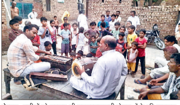
रोहतक। ग्रामीणों को सरकार की जनकल्याणकारी योजनाओं के प्रति जागरूक करते हुए भजन पार्टी।